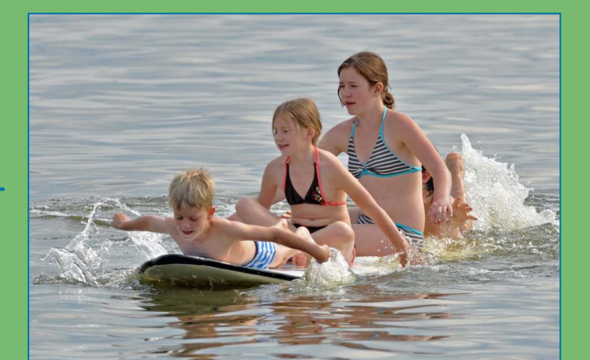
Kinder sind besonders gefährdet!